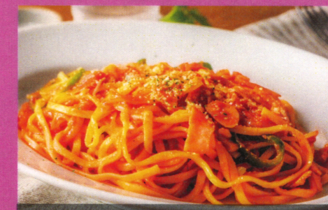
洋食屋さんのナポリタン 750円(税込810円)