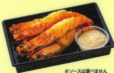
※ソースは選べません 海老フライ(タルタルソース付き) 1尾 300円(税込324円)