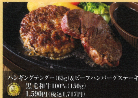
ハンギングテンドー(65g)&ビーフハンバーグステーキ 黒毛和牛100% (150g) 1,590円(税込1,717円)