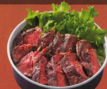
牛ハラミステーキ丼 洋風ソース 1,290円(税込1,393円)