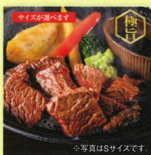
※写真はSサイズです アンガスビーフサイコロステーキ Sサイズ 120g 990円(税込1,069円) Mサイズ 160g 1,280円(税込1,382円) Lサイズ 200g 1,580円(税込1,706円)