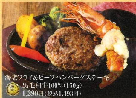
海老フライ&ビーフハンバーグステーキ 黒毛和牛100% (150g) 1,290円(税込1,393円)