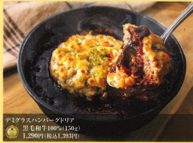
デミグラスハンバーグドリア 黒毛和牛100% (150g) 1,290円(税込1,393円)