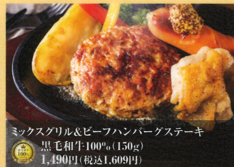
ミックスグリル&ビーフハンバーグステーキ 黒毛和牛100% (150g) 1,490円(税込1,609円)