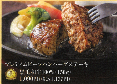
プレミアムビーフハンバーグステーキ 黒毛和牛100% (150g) 1,090円(税込1,177円)