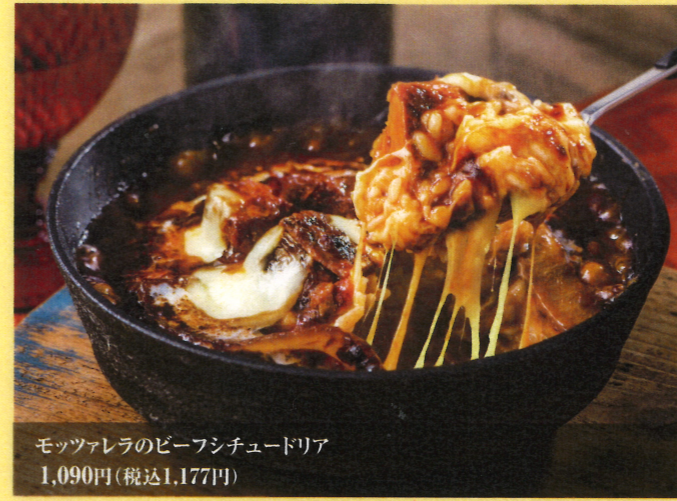
モッツァレラのビーフシチュードリア 1,090円(税込1,177円)