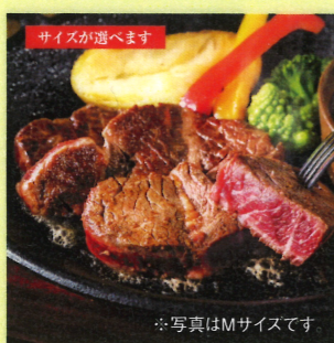
※写真はMサイズです ハンギングテンドーステーキ Mサイズ 190g 1,280円(税込1,382円) Lサイズ 260g 1,580円(税込1,706円)