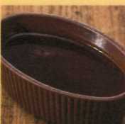
黒デミグラスソース