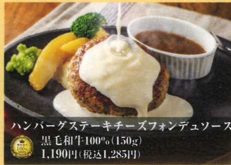
ハンバーグステーキチーズフォンデュソース 黒毛和牛100% (150g) 1,190円(税込1,285円)