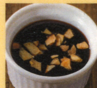
ガーリック醤油ソース