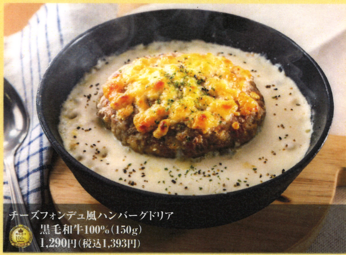
チーズフォンデュ風ハンバーグドリア 黒毛和牛100% (150g) 1,290円(税込1,393円)