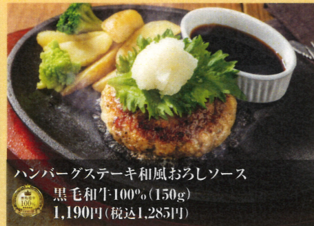
ハンバーグステーキ和風おろしソース 黒毛和牛100% (150g) 1,190円(税込1,285円)