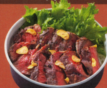
牛ハラミステーキ丼 和風ソース 1,290円(税込1,393円)