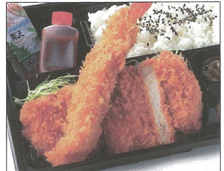
ロースかつと大海老フライ弁当 1,100(税込)