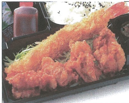
鶏の唐揚げと大海老フライ弁当 990(税込)