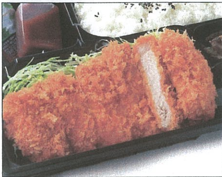
手仕込みロースかつ弁当 830(税込)