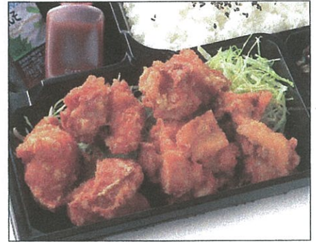
手仕込み鶏の唐揚げ弁当 770(税込)