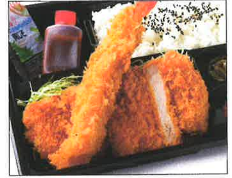
ロースかつと大海老フライ弁当 1280(税込)