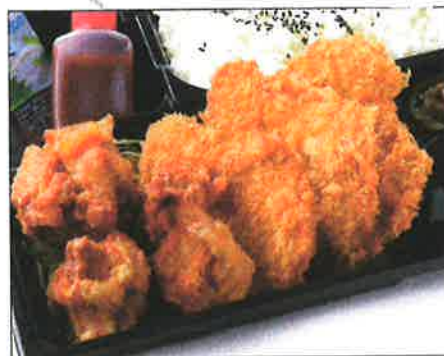
ヒレかつと鶏の唐揚げ弁当 1300(税込)