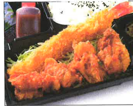
鶏の唐揚げと大海老フライ弁当 1090(税込)