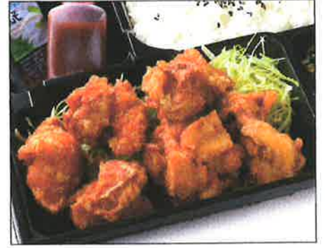
手仕込み鶏の唐揚げ弁当 880(税込)