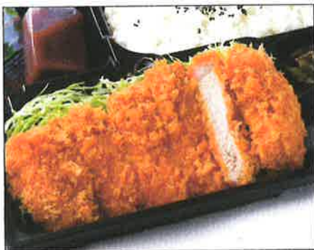
手仕込みロースかつ弁当 980(税込)